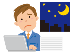
帰社後の入力作業